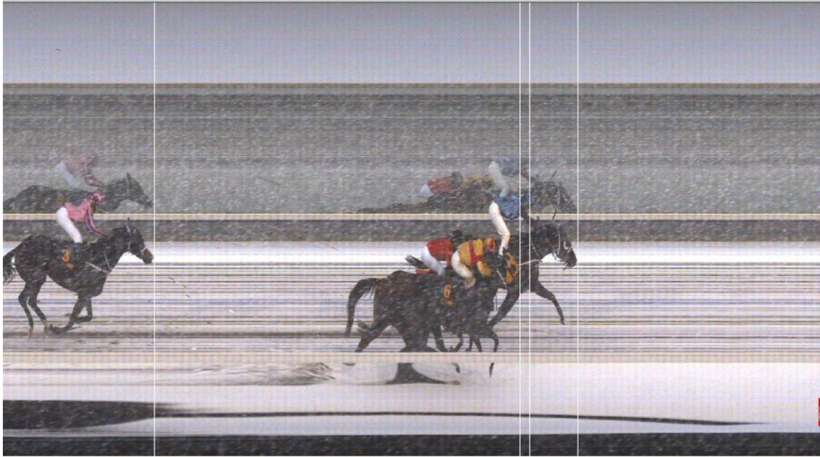
LOPP 5 SILVERHANDICAP