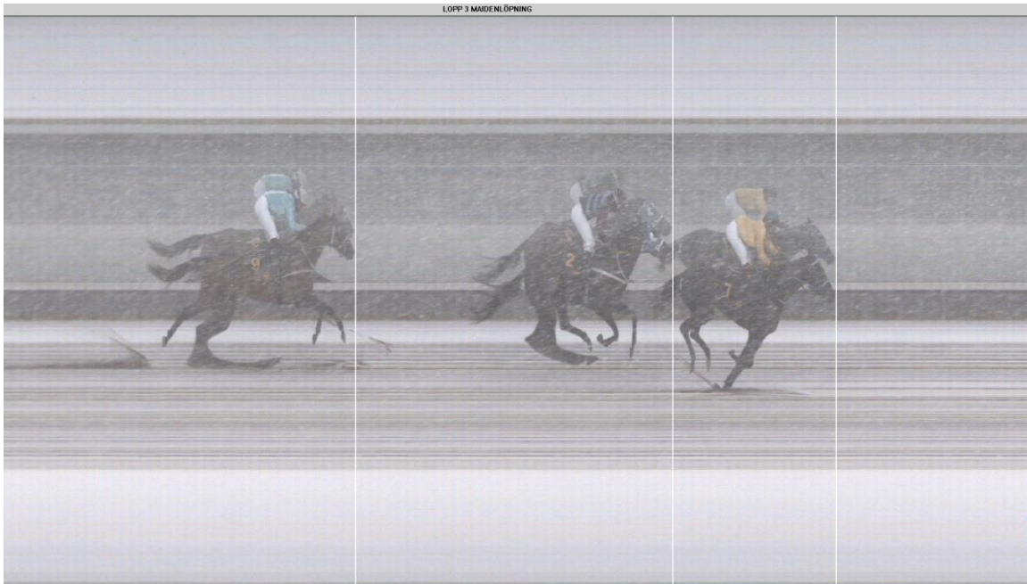
LOPP 3 MAIDENLÖPNING