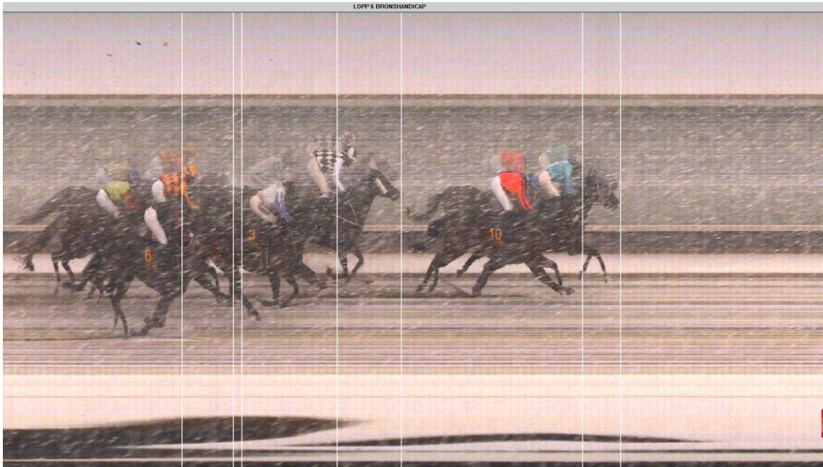
LOPP 6 BRONSHANDICAP