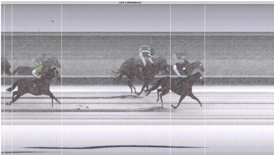
LOPP 4 JÄRNHANDICAP