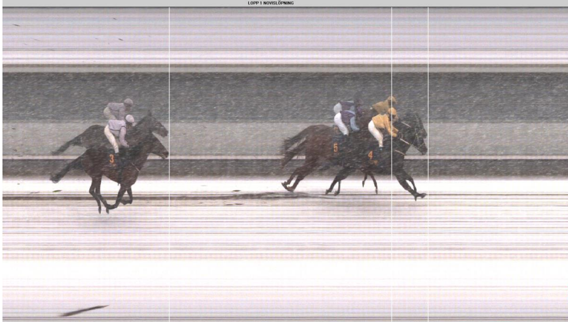
LOPP 1 NOVISLÖPNING